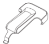
Зажим для ремня